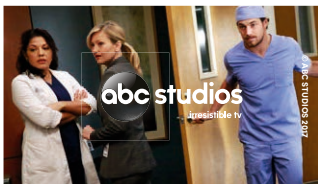
Hele sesonger i ABC Studios-arkivet.