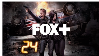
Se hele siste sesong i Fox-arkivet.