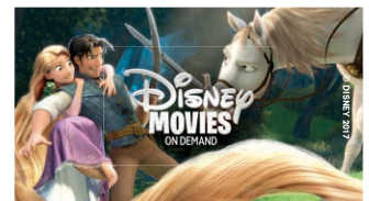
Helaftens Disney-filmer i arkivet.