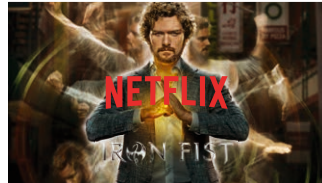
Strøm Iron Fist på Netflix.*