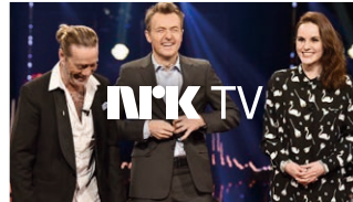
Se Skavlan fra fredag på NRK Nett-TV.