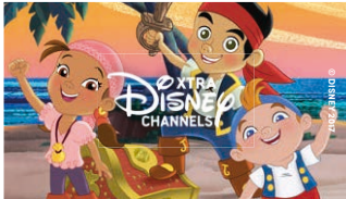
Den beste underholdningen for barna.