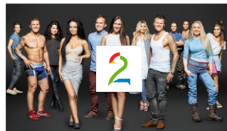
Siste episode finner du i Ukesarkivet.