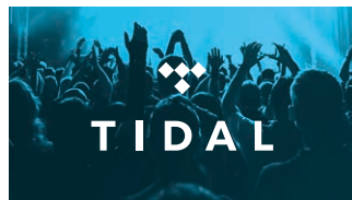
Musikk rett i stua med TIDAL.