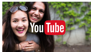
Del opplevelsen på den store TV-skjermen.