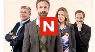
Se alle episodene i TVNorge-arkivet.